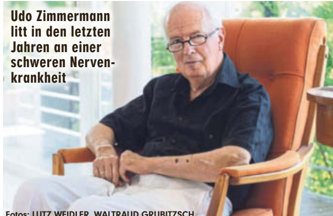
Udo Zimmermann litt in den letzten Jahren an einer schweren Nervenkrankheit