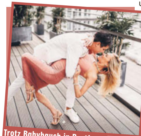
Trotz Babybauch in Bestform!