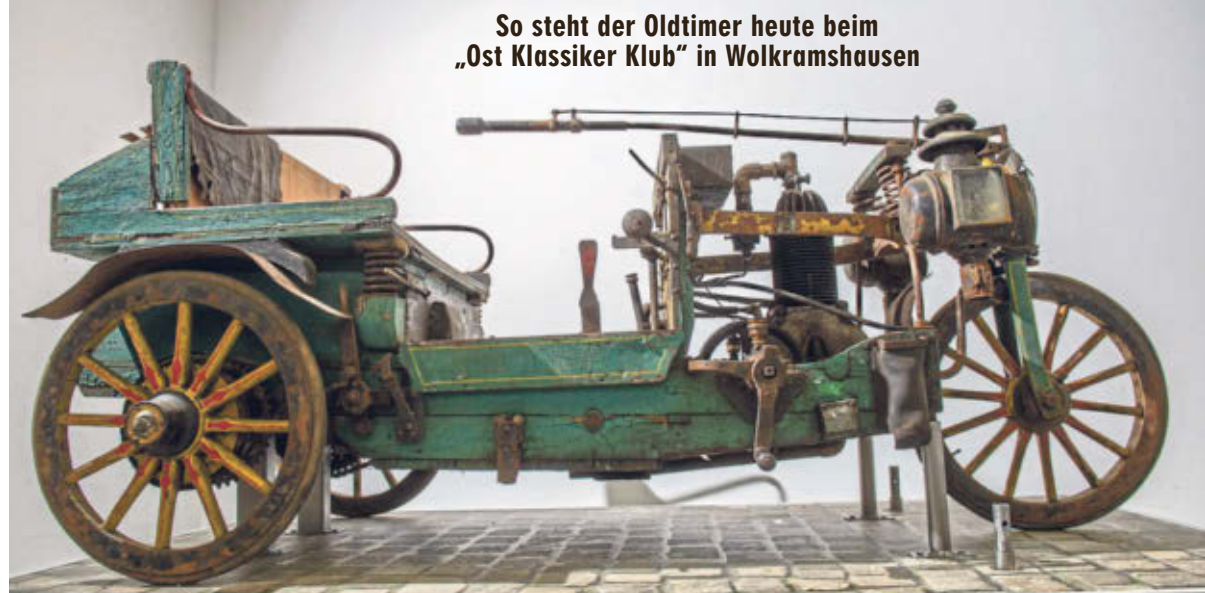
So steht der Oldtimer heute beim „Ost Klassiker Klub“ in Wolkramshausen