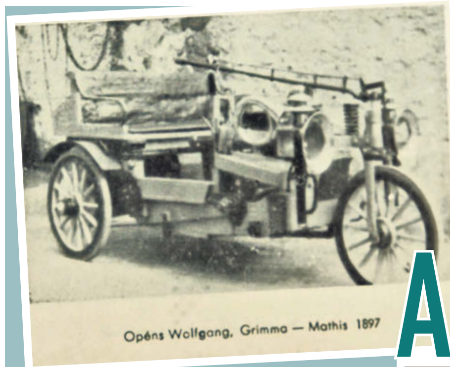
Opéns Wolfgang, Grimma – Mathis 1897